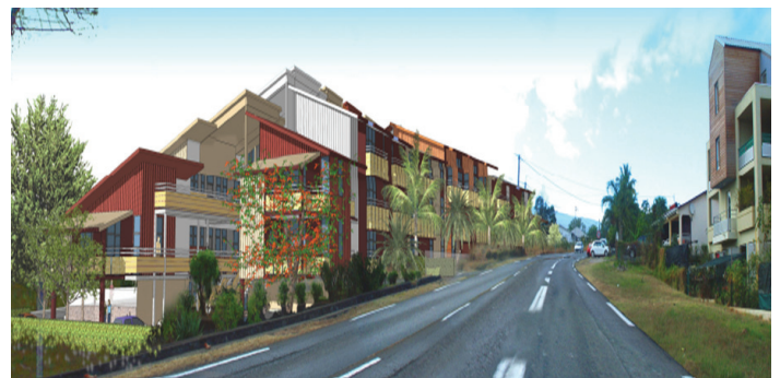
Opération SEDRE « Le Corrossole »

l'Eperon » portant sur la création de 48 logements locatifs sociaux. La garantie porte cette fois sur le remboursement de la somme de 2 420 774 €. Tandis que sur l'opération « Corrossole » (48 Logements locatifs très sociaux - LLTS), le Conseil municipal a validé la garantie pour le remboursement de la somme de 1 871 716 €.