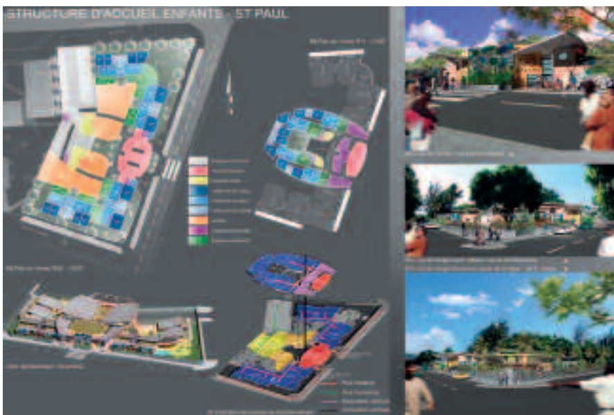
LA FIN DES TRAVAUX EST PROGRAMMÉE POUR COURANT 2012.

Le coût total du projet est évalué à plus de 6 M€ avec une participation conséquente de 4,5 M€ de Caisse d'Allocations Familiales, partenaire de la Mairie de Saint-Paul.