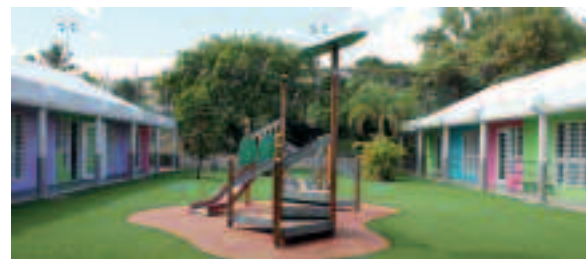
DE VÉRITABLES CLASSES À LA PLACE DES SALLES MODULAIRES À L'ÉCOLE « PAILLE-EN-QUEUE ».

Seront complètement réhabilitées, les trois salles de classes et les sanitaires de l'école maternelle Paille-en-queue, sinistrés suite à l'incendie survenu en début d'année. Le programme des travaux qui prévoit aussi la réfection de la totalité de la cour de cette école de Plateau Caillou, ainsi que le plan de financement arrêté à 298 375 € ont été adoptés par le conseil municipal.