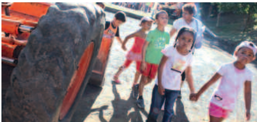
LES UNS ONT APPRÉCIÉ LE JUS DE CANNE, LES AUTRES ONT BEAUCOUP RETENU DU MÉTIER D'AGRICULTEUR.

LES ÉLÈVES DES ÉCOLES DE BELLEMÈNE ONT PARTICIPÉ NOMBREUX À CETTE JOURNÉE DE L'EUROPE.