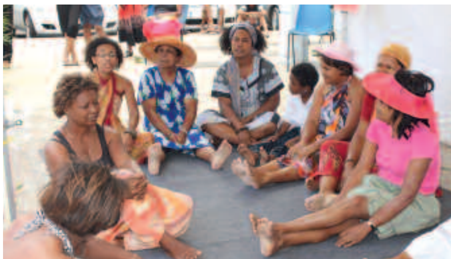
ENVIRON 1 154 ASSOCIATIONS SONT RECENSÉES SUR SAINT-PAUL.