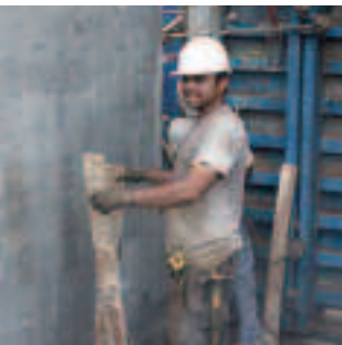
04 LA DOUBLE CRÈCHE DE L'ÉTANG EN CHANTIER

SAINT-PAUL SE CONSTRUIT AVEC VOUS ET POUR VOUS