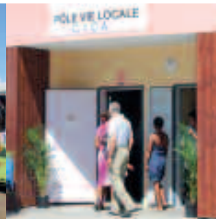
14 LE CENTRE D'INFORMATIONS ET DE CONSEILS AUX ASSOCIATIONS