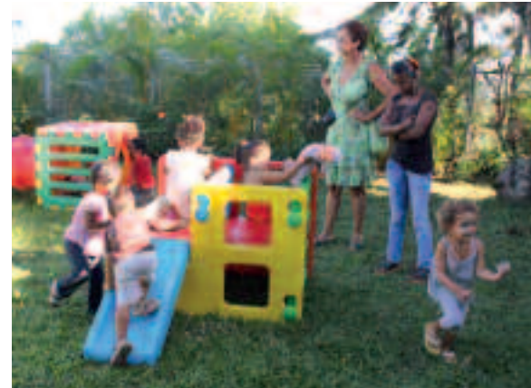
LE JARDIN D'ENFANTS MUNICIPAL « LES LIBELLULES » À BOIS-DE-NÈFLES A ÉTÉ INAUGURÉ LE 22 AVRIL.