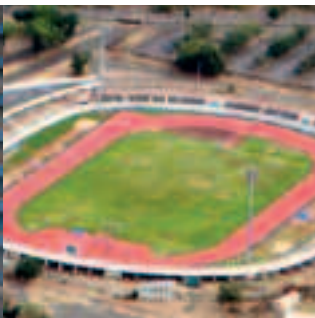
06 LE STADE OLYMPIQUE FAIT PEAU NEUVE