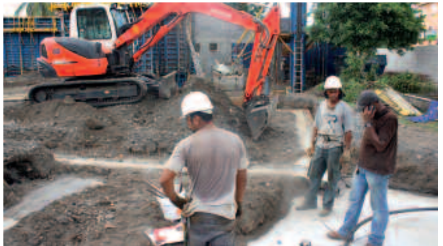
LES TRAVAUX ONT DÉBUTÉ EN DÉBUT D'ANNÉE, LA STRUCTURE SERA SUR DEUX NIVEAUX.

Chaque entité aura ses espaces d'éveil et d'activités, et disposera de salles de propreté et de sommeil. De même qu'un atrium, une salle de lecture, une salle de repas, ainsi qu'une partie administrative avec secrétariat, direction et infirmerie. Les locaux du personnel et une salle de réunion seront mutualisés à l'étage. Par ailleurs, les locaux pour les bébés disposeront de « biberonneries ». L'ensemble de cette