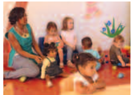
LA MICRO-CRÈCHE CACHE-CACHE NICOLAS A ÉTÉ INAUGURÉE MI-MAI.