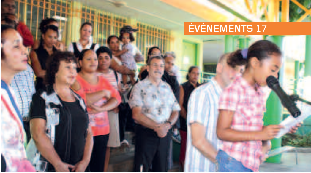
L'ÉCOLE PRIMAIRE DE SANS SOUCI A ÉTÉ DÉNOMMÉE « ÉCOLE JASMIN ROBERT ».

De nombreux événements ont continué de rythmer la vie de la commune depuis le début de cette année 2011. Retour en photos sur quelques uns des principaux temps forts des six derniers mois.