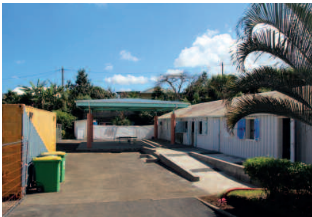
L'ÉCOLE DE BARRAGE SERA PLUS ACCUEILLANTE.

De l'Étang à l'Éperon, en passant par Barrage et le Guillaume, plusieurs autres écoles maternelles et primaires de la Commune ont bénéficié récemment des travaux de réhabilitation et d'aménagement dans un souci d'amélioration de l'accueil des petits Saint-Paulois. « Autour d'une école agréable, fonctionnelle, avec des équipements structurants, il peut se créer une véritable synergie entre les différents partenaires enseignants, associations, parents d'élèves, qui génèrent une dyna-