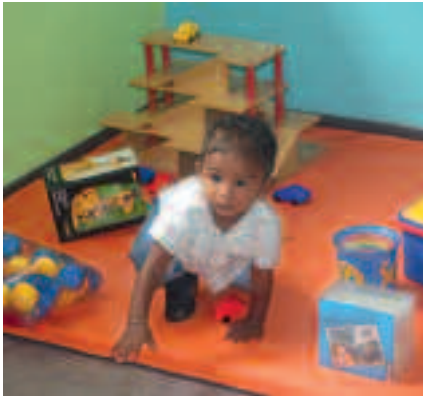
DIX PLACES D'ACCUEIL SUPPLÉMENTAIRES AU SEIN DE LA MICRO-CRÈCHE « ÉTOILE DE MER » À PLATEAU CAILLOU.