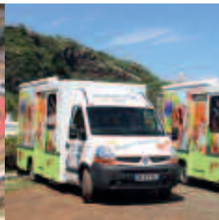
12 DEUX MÉDIABUS POUR UNE LECTURE DE PROXIMITÉ