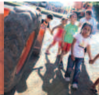
16 LA FILIÈRE CANNE SE STRUCTURE