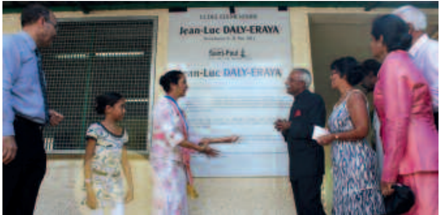
L'ÉCOLE ÉLÉMENTAIRE DE LA GRANDE FONTAINE S'APPELE DÉSORMAIS « ÉCOLE JEAN-LUC DALY-ERAYA ».