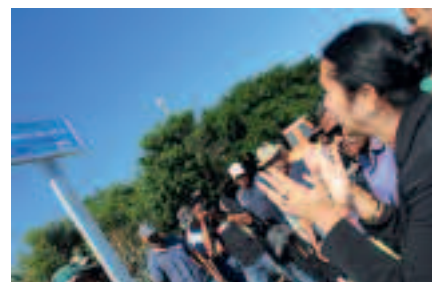
LE CHEMIN BELMONT A ÉTÉ INAUGURÉ EN PRÉSENCE DE LA DÉPUTÉE-MAIRE HUGUETTE BELLO ET DU PRÉSIDENT DE LA CHAMBRE D'AGRICULTURE.