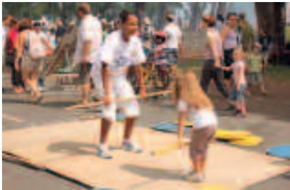
L'OPÉRATION JOUR DE SPORT SANTÉ A RÉUNI PLUS DE 6000 PERSONNES.