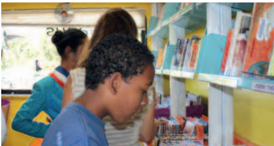
LA MUNICIPALITÉ SOUHAITE FAVORISER L'ACCÈS À LA LECTURE ET LA CULTURE POUR TOUS.

Il s'agit de favoriser l'accès à la lecture et à la culture pour tous. Les deux véhicules modernes et spacieux, aménagés en véritables médiathèques ambulantes sont riches de plus de 6 000 documents. Ils couvrent ainsi différents quartiers de la commune et proposent le prêt de livres, de bandes dessinées, de périodiques, de CD, de DVD et même de jeux, à destination de toutes les générations. Le médiabus instaurera une relation de proximité privilégiée avec ses usagers. Se voulant efficace et régulière, une couverture de l'ensemble du territoire est prévue tous les 15 jours. (voir planning des tournées sur le site de la Mairie de Saint-Paul http://www.mairie-saintpaul.fr )