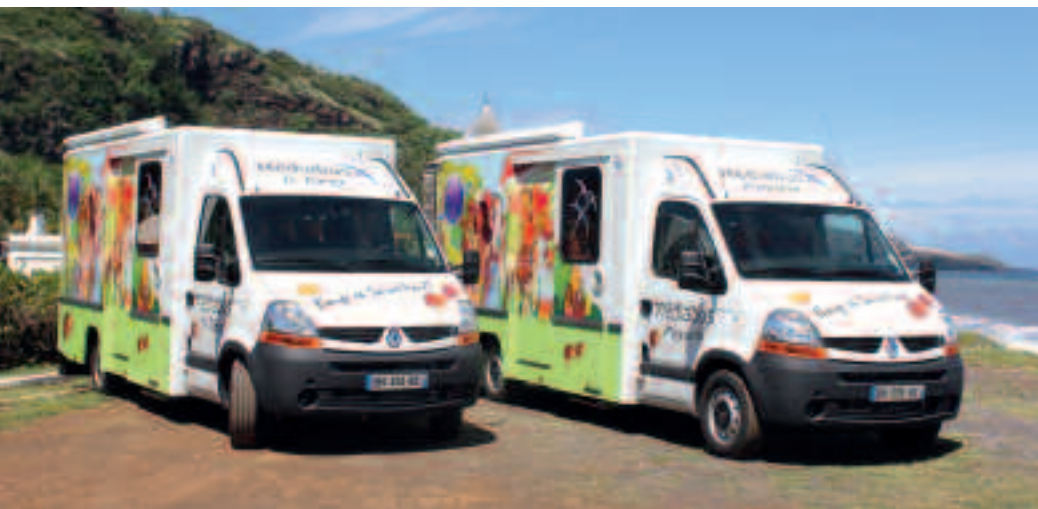
LES MÉDIABUS SONT RICHES DES PLUS 6 000 DOCUMENTS.

Sillonner les quartiers de Saint-Paul, à la rencontre de la population éloignée des équipements culturels afin de rapprocher le Livre des habitants. Telle est la mission des deux « Médiabus » en service depuis peu.