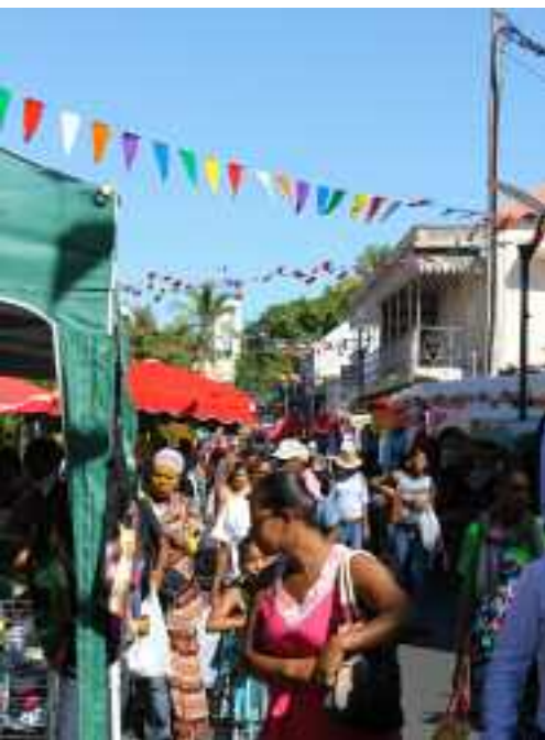
LES TRADITIONNELLES FÊTES DU MOIS DE JUILLET A ATTIRÉ BEAUCOUP DE MONDE EN VILLE.